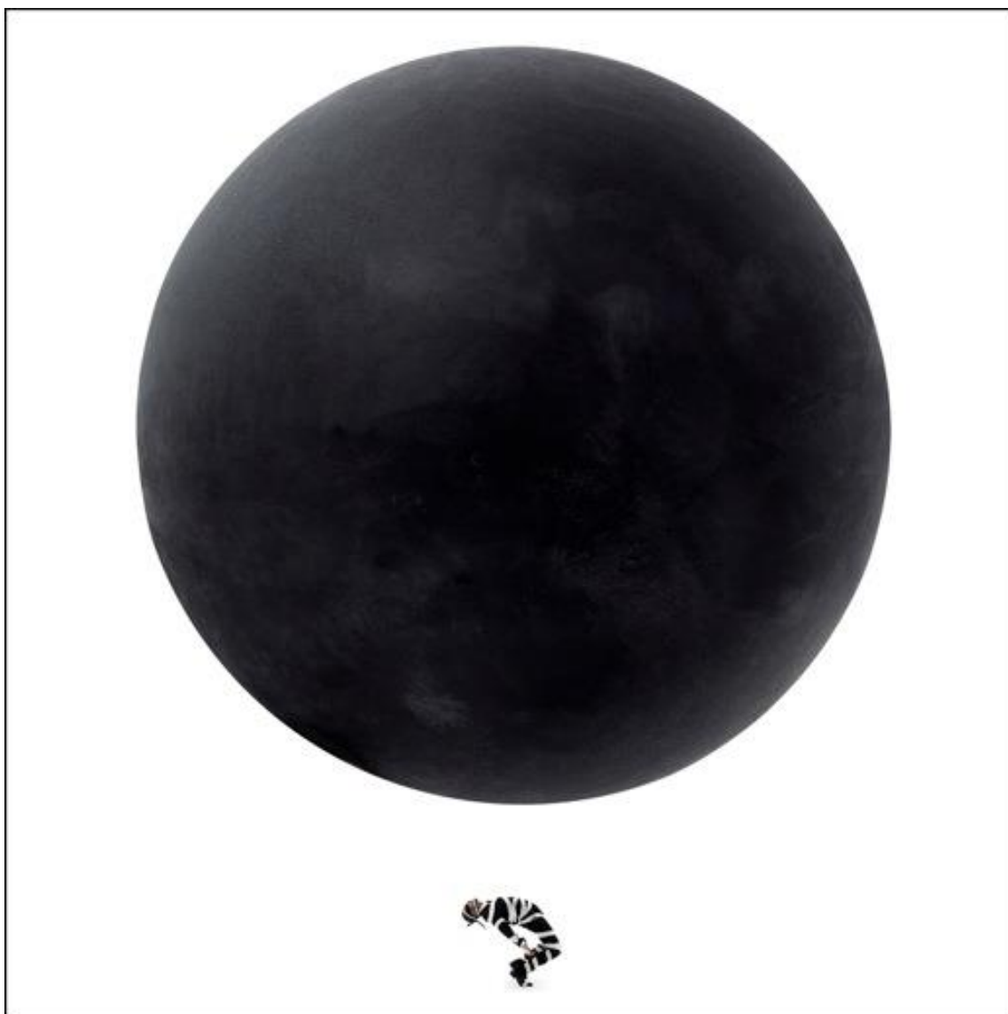
Légende : A Small Man in a Big World – Black Earth, 2013

Tél. : 01 40 21 05 15 ou par mail auprès de Marie-Lou Lizé : marie-lou@catherine-dantan.fr