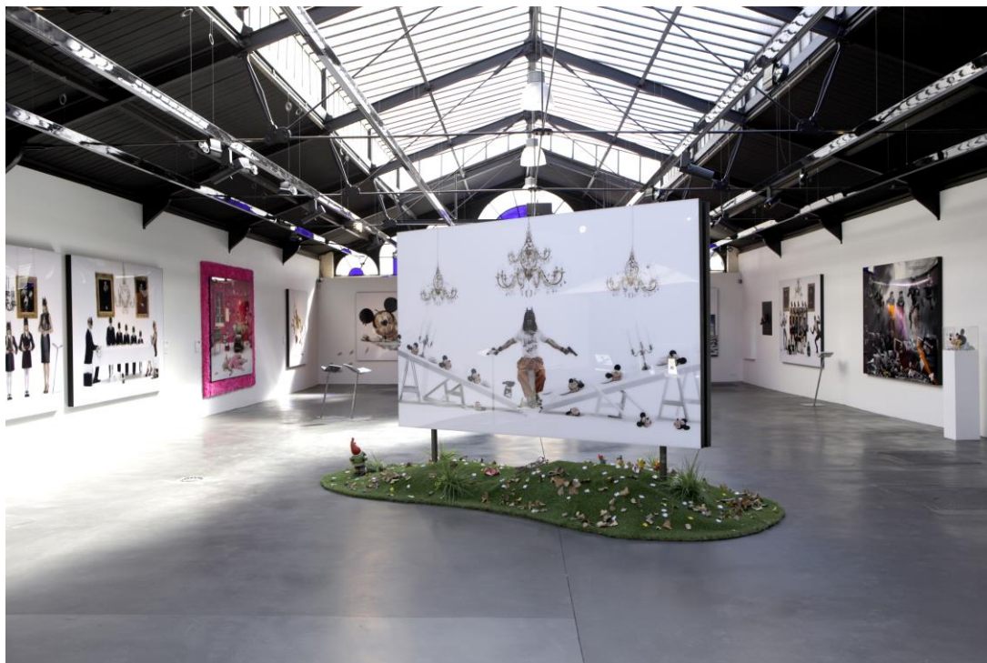
Exposition "Wonderful World" de Gérard Rancinan à la Galerie Valérie Bach, 2012

Depuis Avril 2012, la galerie Valérie Bach s'est installée dans un grand espace situé au 6 rue Faider à Bruxelles. Cet emplacement exceptionnel, construit sous verrière, abritait l'ancienne patinoire royale de Belgique. Ce site est classé au patrimoine architectural de Belgique.