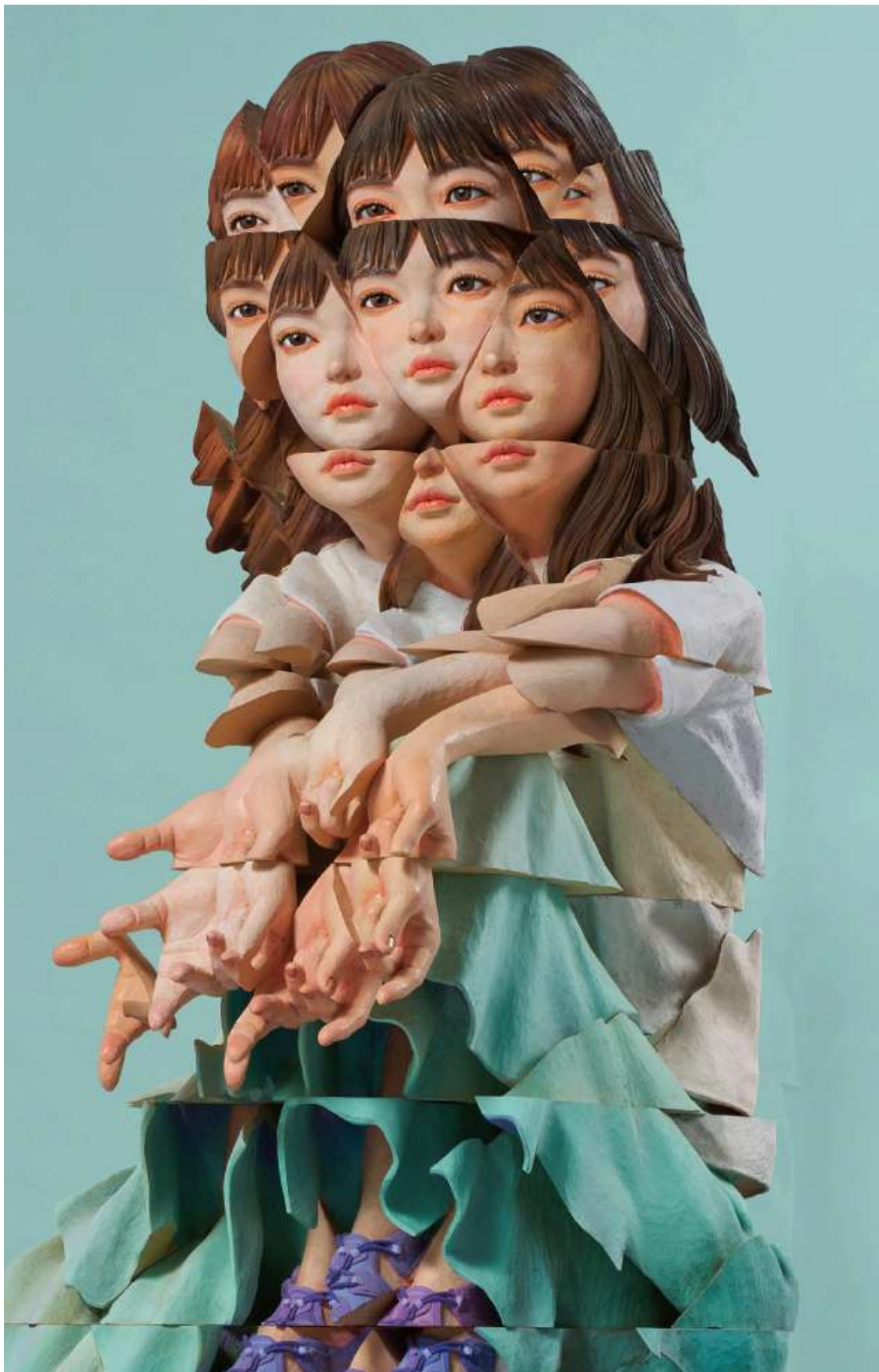
明鏡プリズム | Insight Prism

2025 Paint on Japanese nutmeg and katsura